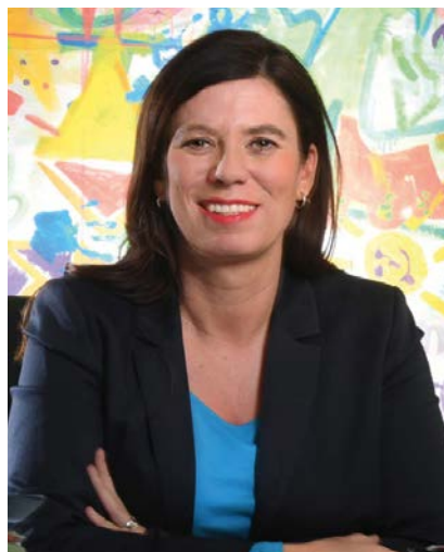
Sandra Scheeres , Senatorin für Bildung, Jugend und Familie des Landes Berlin

Senatorin für Bildung, Jugend und Familie